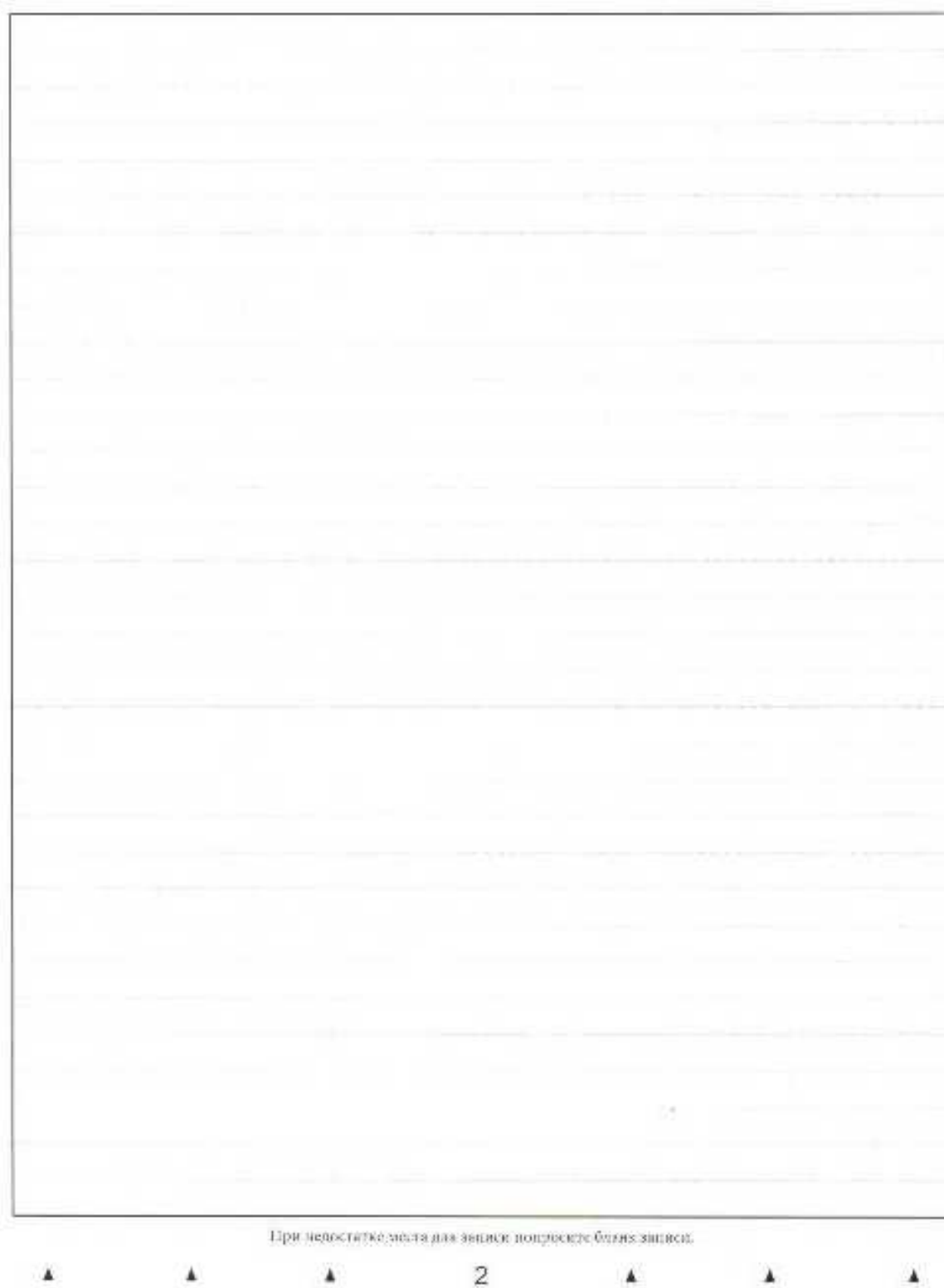
Рис. 6. Обратная сторона двустороннего бланка записи

В случае использования двустороннего бланка записи при недостатке места для оформления итогового сочинения (изложения) на лицевой стороне бланка записи участник может продолжить записи на оборотной стороне бланка (рис. 6), сделав внизу лицевой стороны запись «смотри на обороте».