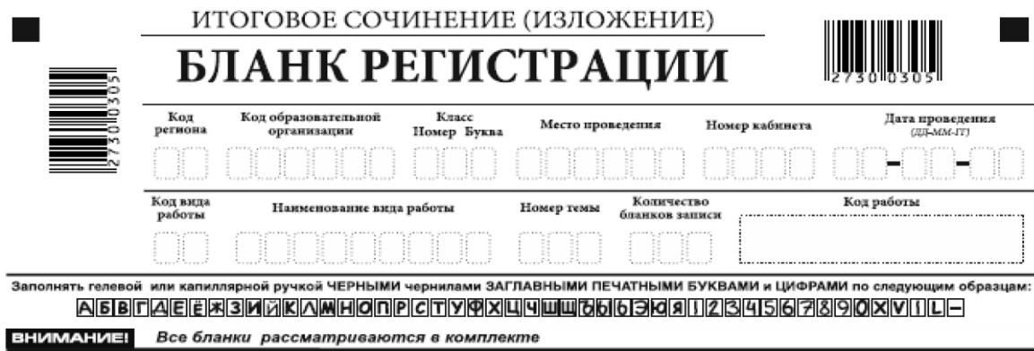
Рис. 2 Верхняя часть бланка регистрации

По указанию члена комиссии по проведению итогового сочинения (изложения), осуществляющего инструктаж участников итогового сочинения (изложения), участником заполняются все поля верхней части бланка регистрации (см. табл. 1).